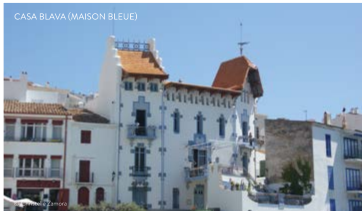
CASA BLAVA (MAISON BLEUE)

du surréalisme. En haute saison, de petites expositions lui rendent souvent hommage dans les galeries d'art du village.